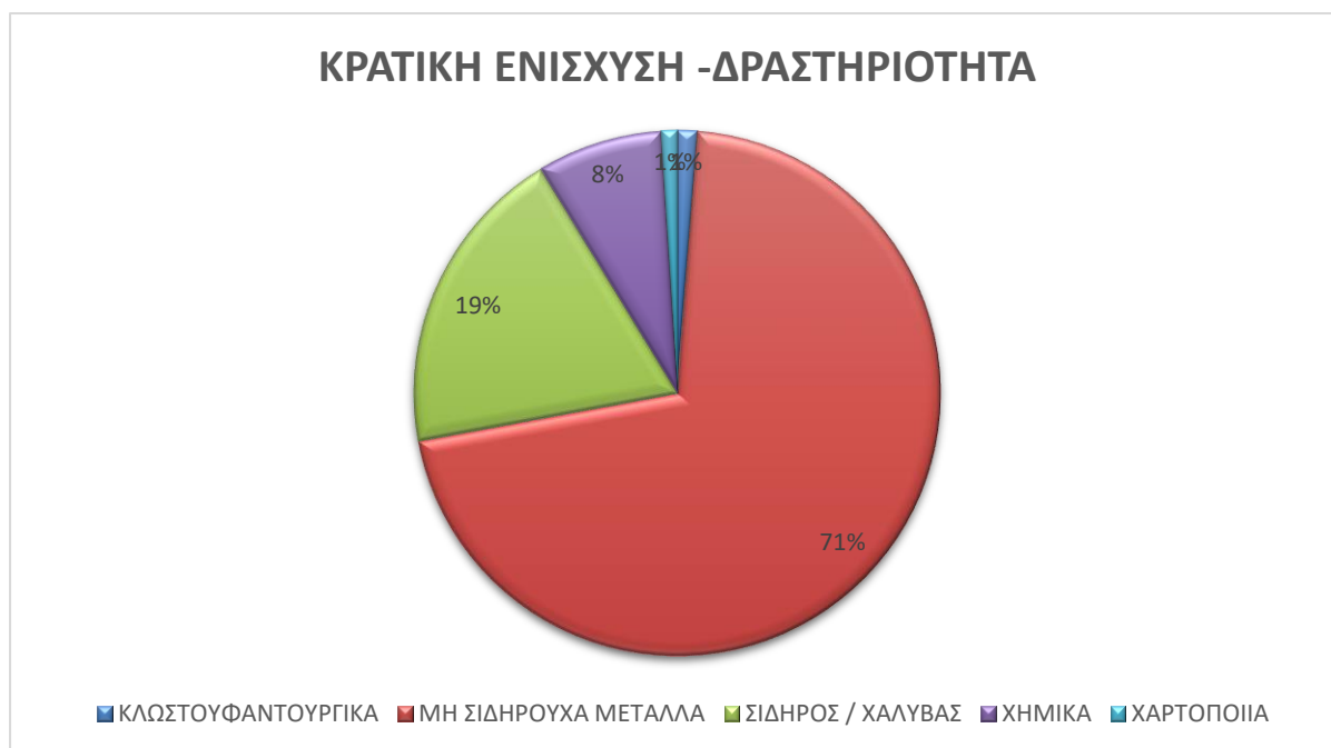
Σχήμα-1: Συνοπτικά αποτελέσματα Συμπληρωματικής εκ των υστέρων τελικής Εκκαθάρισης Αντιστάθμισης περιόδου 2019-2020

Στο παρακάτω Σχήμα-1 παρατίθενται συνοπτικά τα αποτελέσματα της Συμπληρωματικής εκ των υστέρων τελικής Εκκαθάρισης Αντιστάθμισης περιόδου 2019-2020 ανά βιομηχανική δραστηριότητα.